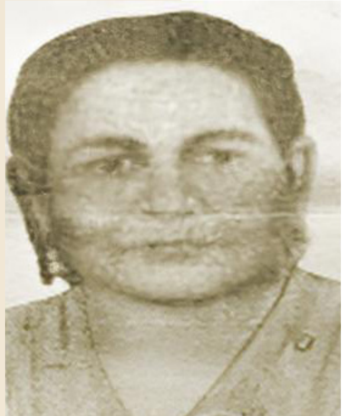
Figura clave del agrarismo en el norte de México e integrante del pensamiento del Partido Liberal Mexicano.