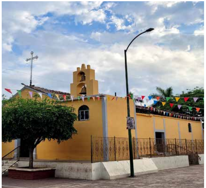
Iglesia de Tacuichamona.