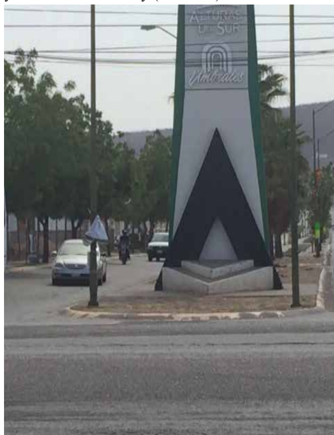
Regidores autorizaron la recepción del fraccionamiento Alturas del Sur etapa IX.

ÁREA DE VIALIDADES MUNICIPALES: Se contempla el desarrollo de 19 (diecinueve) vialidades, con una superficie de 40,622.451 m 2 , con la nomenclatura y sección siguiente: Blvd. Juan Ley Fong (22.40 m.), Paseo Agricultores Pte. (20.00 m.), Paseo Agricultores Ote. (14.00 m.), C. Monte Jaya (15.00 m.), C. Cima del Baker (12.00 m.), C. Cima del Teyotl (12.00 m.), C. Cima del Briton (12.00 m.), C. Cima del LLamatzin (12.00 m.), C. Cima del Xocotl (12.00 m.), C. Cima del Elgon (12.00 m.), C. Cima del Pamir (12.00 m.), C. Cima del Erebus (12.00 m.), C. Cima del Gardner (12.00 m.), Av. Monte Palpana (12.00 m.), Av. Monte Pili (12.00 m.), Av. Monte Emin (12.00 m.), Av. Monte Balbi (12.00 m.), Av. Monte Kilimanjaro (12.00 m.) y Av. Monte Chinchey (12.00 m.).