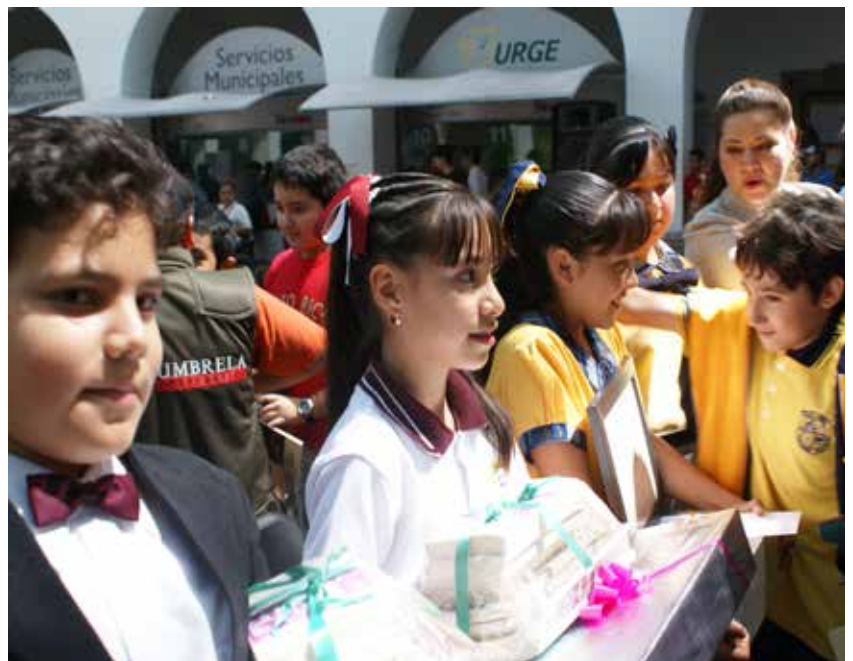
Tercer concurso Niño cronista realizado en el año de 2010.

Pág. 16 Estado de Occidente en su primer bicentenario