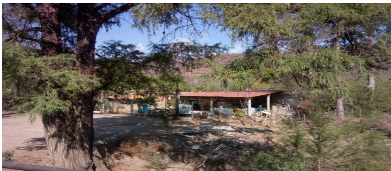
Con sus veintidós comisarías, San Miguel de Tepuche vive y deja vivir, y presume de sus hazañas como la de ser Tepuche donde se integró el primer ejido en Sinaloa.

Con sus veintidós comisarías, San Miguel de Tepuche vive y deja vivir, y presume de sus hazañas como la de ser Tepuche donde se integró el primer ejido en Sinaloa. Presume también de ser la tierra nativa del general Juan M. Banderas, al que por mal nombre se conocía como El Agachado, debido a su gran estatura. También blasona Tepuche de haber sido apoyadora del maderismo al través de la familia Ramos–Obeso y Ramos–Esquer. Igualmente, Tepuche se enorgullece de que entre sus hijos predilectos figure un técnico en Hidráulica de tanto renombre como el ingeniero Lázaro Ramos Esquer.