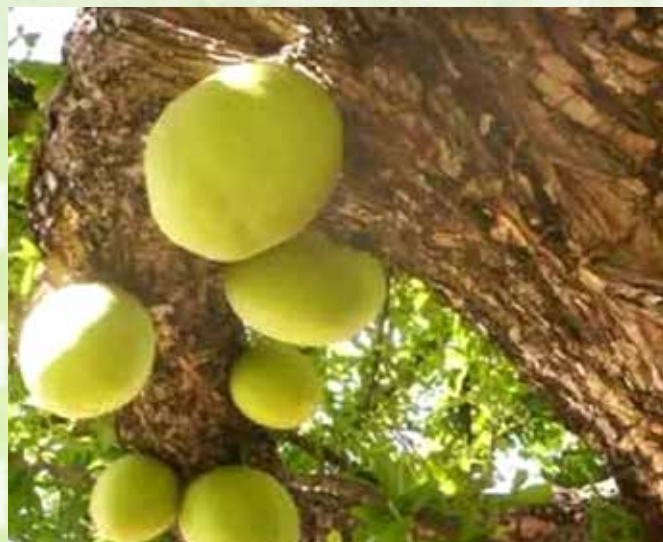
Las bolas de ayale se usan para fermentar vino en su interior, que por lo general es tequila o mezcal.

El limoncillo es una especie de zacate con el que se hace un buen té endulzado preferencialmente con panocha, agarrando un sabor mejor que la canela o el café. Para acompañar