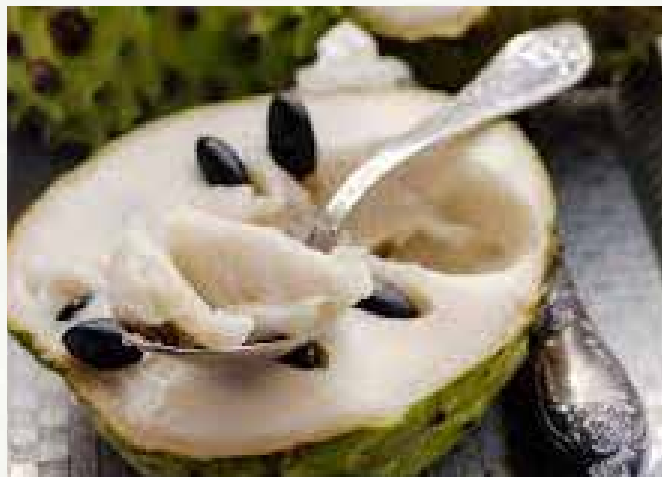
Son muy sabrosas las chirimollas, son unas bolas parecidas a las calabazas, son muy dulces, desgraciadamente ya se están acabando.

Con el palo dulce se hace agua fresca muy buena, nomás es cuestión de echarle al agua de