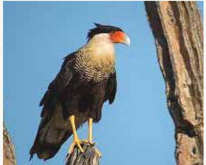
El quelele, insípido y desagradable, solo se comía por necesidad extrema.

Las palomas de ala blanca o de alas azules